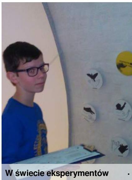
W świecie eksperymentów