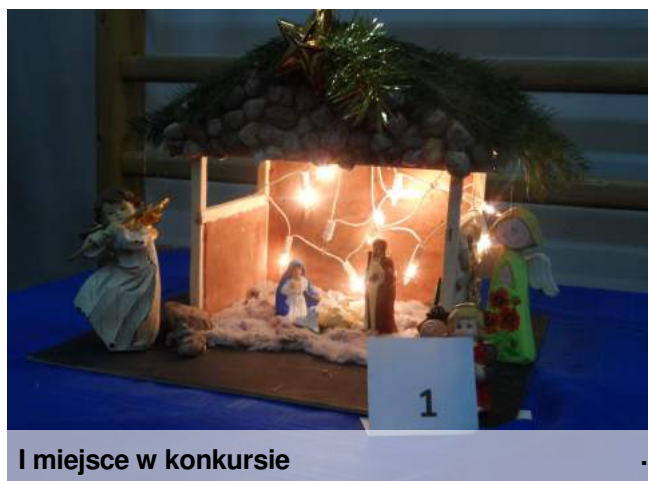
I miejsce w konkursie