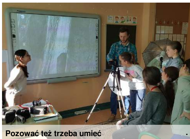
Pozować też trzeba umieć