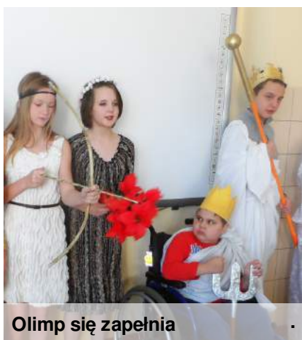
Olimp się zapelnia