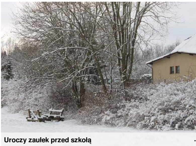
Uroczy zaulek przed szkołą