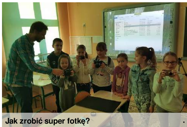
Jak zrobić super fotkę?