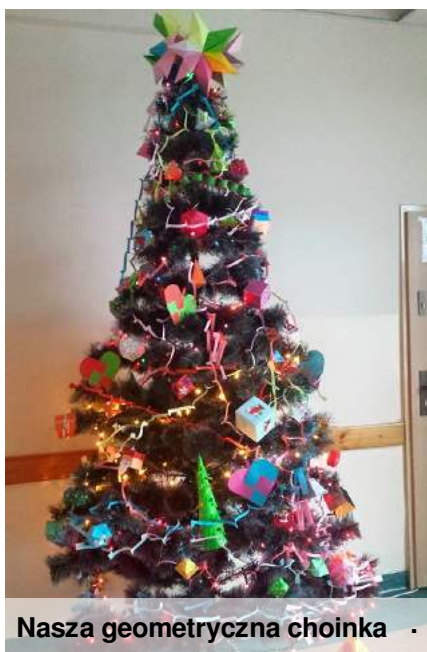
Nasza geometryczna choinka

22 grudnia w szkole mieliśmy klasowe wigilie, wszyscy składali sobie życzenia, w końcu jesteśmy taką szkolną rodziną. Klasa V nawet przygotowała dla rodziców Jasełka.