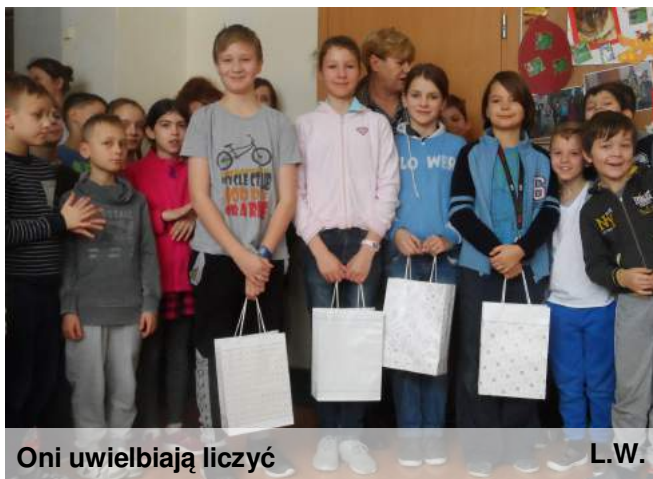
Oni uwielbiają liczyć