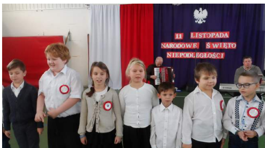
II klasa dzielnie śpiewa