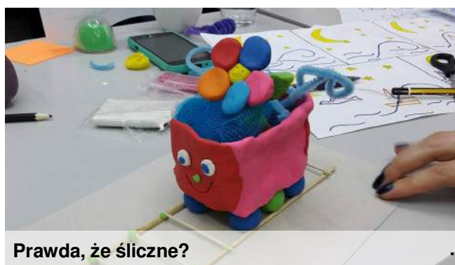
Prawda, że śliczne?