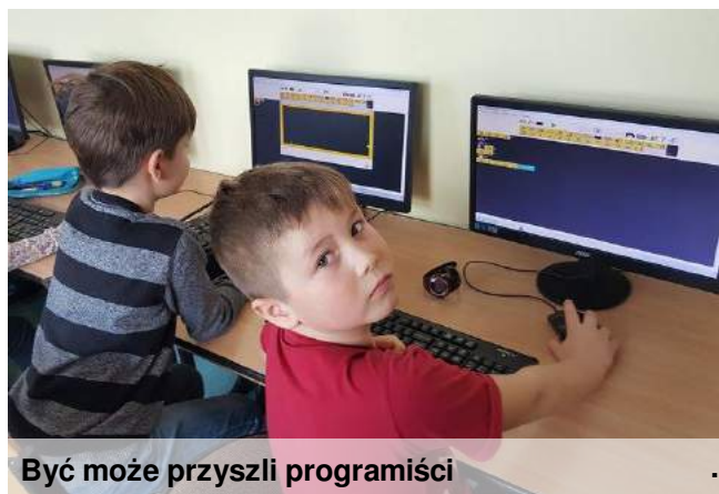
Być może przyszli programiści