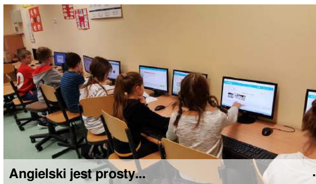
Angielski jest prosty...