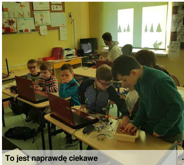
To jest naprawdę ciekawe