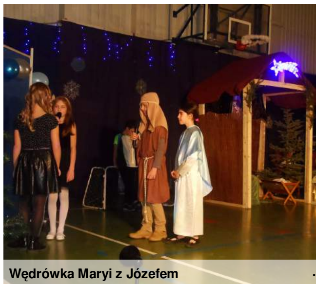
Wędrowka Maryi z Józefem