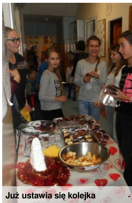
Już ustawia się kolejka

Panie z Rady Rodziców podjęły świetną inicjatywę, mającą na celu zbiórkę pieniędzy na potrzeby naszej szkoły. Zorganizowały w szkole cykliczną sprzedaż samodzielnie przygotowanych słodkich smakołyków, tzw. „Słodkie czwartki”. W tym dniu podczas wszystkich przerw uczniowie i nauczyciele mogą zakupić słodką przekąskę, a tym samym dorzucić grosik na cele uczniowskie. Stoisko z domowymi wypiekami cieszy się ogromnym zainteresowaniem, a przysmaki znikają w ekspresowym tempie. Z niecierpliwością czekamy na kolejne „Słodkie czwartki”.